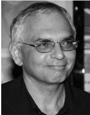
Karen Shakhnazarov (réalisateur LE TIGRE BLANC (Panorama))

Directeur général des Studios Mosfilm à Moscou, Karen Shakhnazarov est une personnalité importante dans la vie politique russe. A la fois réalisateur, écrivain (auteur de nouvelles: « Les jeunes dirigeables », « Le Courrier ») et scénariste (« Les dames invitent leurs cavaliers »), il a signé en 2009 une adaptation de la nouvelle de Tchekhov « Salle n°6 » qui a été très bien accueillie par la critique en France. Ses films historiques « L'assassin du Tsar », « Le cavalier de la mort », « L'Empire perdu » dressent une image complexe de la Russie et de l'Union Soviétique. Son dernier film « Le Tigre blanc » est une impressionnante fresque mystique parlant de façon romanesque et philosophique de la Deuxième guerre mondiale qui élargit notre vision de la guerre pour en faire la lutte entre le Bien et le Mal.